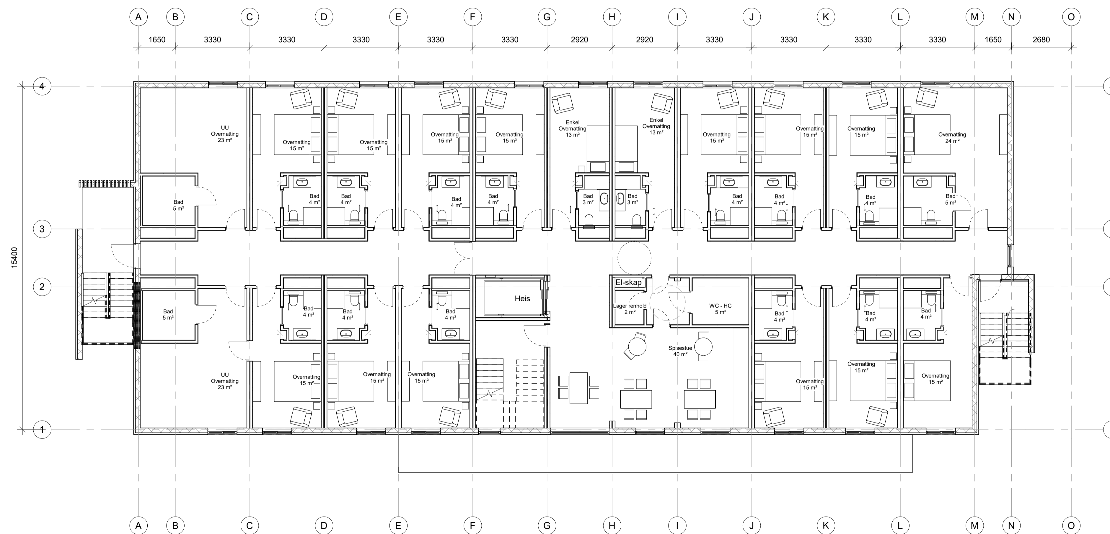
Plan 02 50 Målestokk: 1 : 100