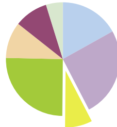
Person som ikke har spiseforstyrrelse