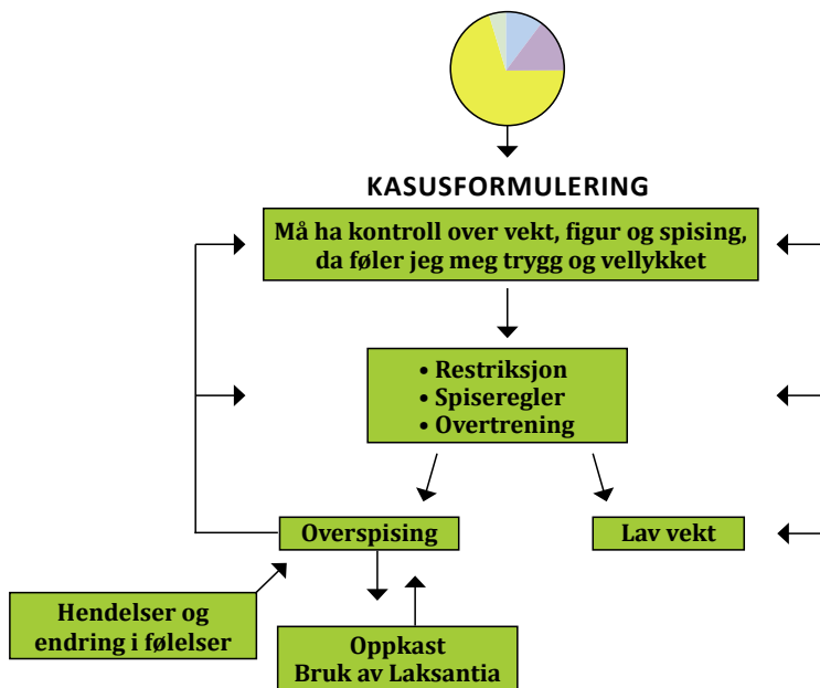
Diagram over opprettholdende mekanismer i en spiseforstyrrelse