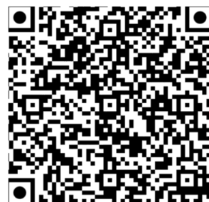
Påmelding og oppdatert program