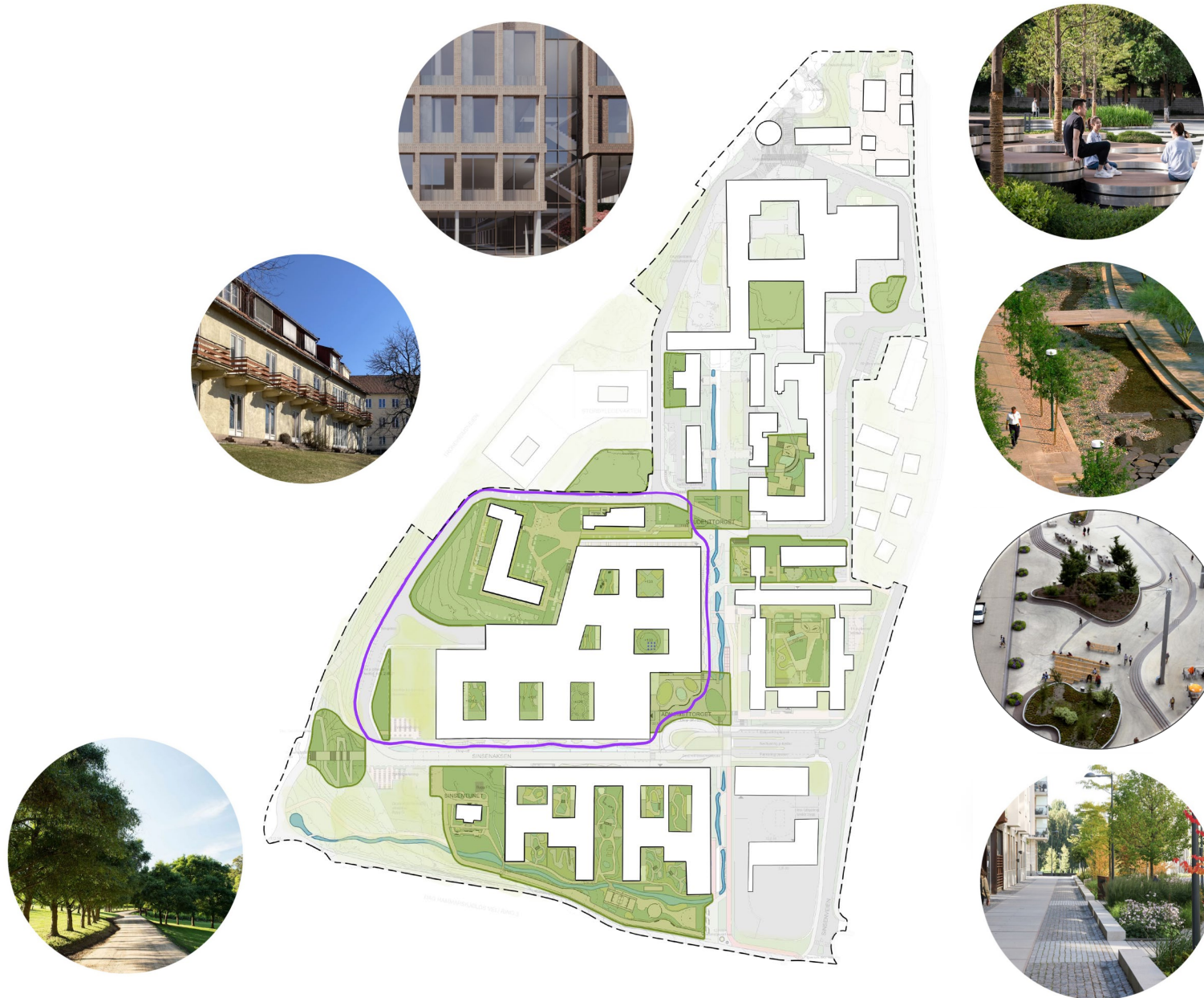
Inspirasjonsbilder for stemning

Vi har etter tilbakemelding fra forrige medvirkningsmøte oppdatert denne turstien og lagt forbindelse i ytterkant- og unna akuttmottak