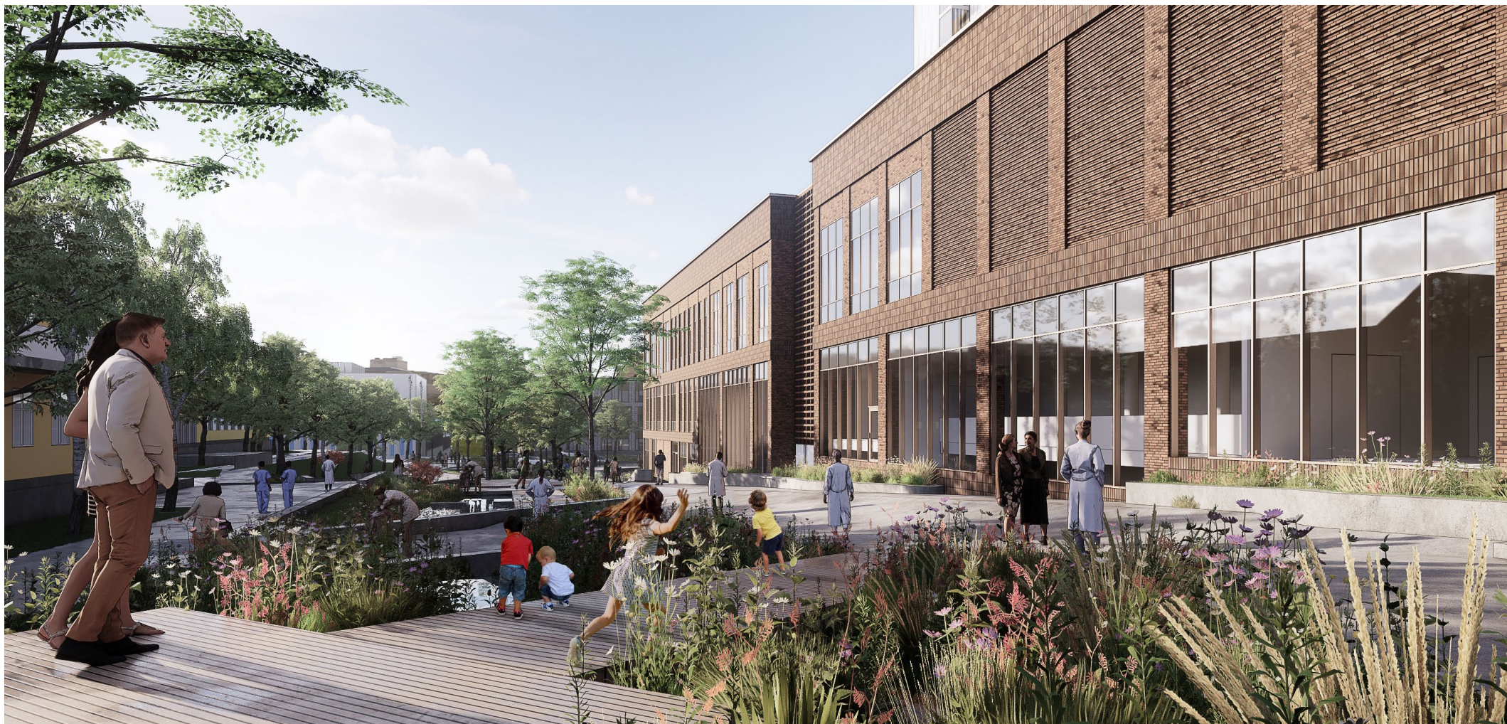
Naturlig lekeområder finner man bla i Akerløperen