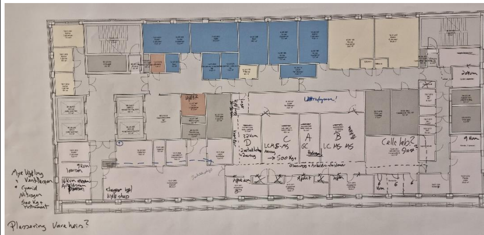
Figur 3- Plan 09