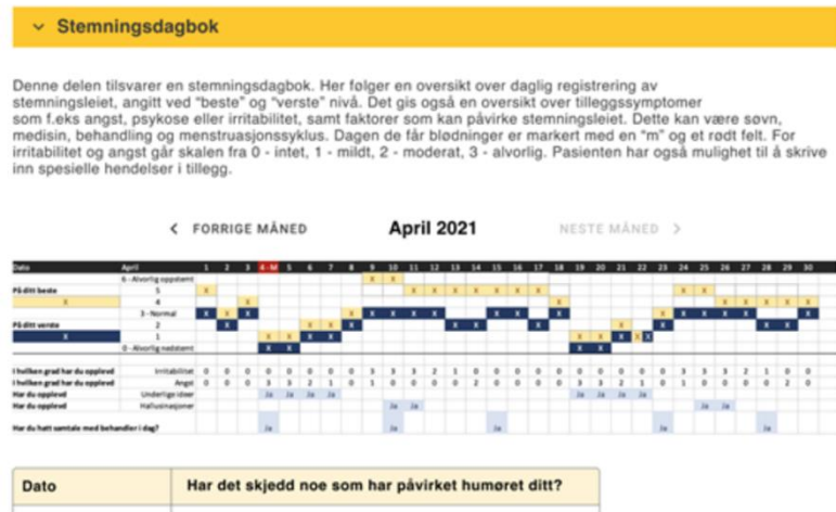
Skjermdump 2. Del av en rapport som er laget med iTandem.

Tanken med iTandem er at en jevn registrering kan gjøre det enklere å huske, for eksempel, hvordan man sov den siste uken eller hendelser som skjer mellom timene, men som er vanskelig å ta opp når man først er i rommet med sin behandler. Noen ganger ønsker du kanskje å jobbe med noen spesifikke problemer og vil se hvordan dette utvikler seg over tid. Målet er å få til et bedre samarbeid mellom deg og din behandler fordi det blir lettere å fokusere på felles mål for behandlingen. Behandleren får en rapport. Denne kan brukes som utgangspunkt for en samtale om det som har fungert eller ikke fungert siden sist. Du velger selv hvilke moduler du ønsker å aktivere, og du og behandleren din bruker rapportene i timene.