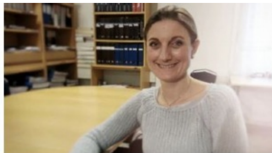
Søsken som pårørende